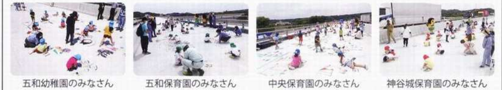
五和幼稚園のみなさん 五和保育園のみなさん 中央保育園のみなさん 神谷城保育園のみなさん

5月25日・26日・28日の3日間、現在工事中の国道1号島田金谷バイパスの新大井川橋にて、地元保育園・幼稚園の園児に完成前の橋の上で遊んでもらう「ふれあい体験イベント」が開催されました。普段、足を踏み入れることができない場所で子どもたちは、舗装前の橋の表面に思い思いに好きな絵を描いたり、ペットボトルをピンに見立てた「ボールンテ遊び」も楽しみました。さらに、ドローンを使った上空からの記念写真も撮影しました。同バイパスは国土交通省浜松河川国道事務所が慢性的な渋滞を解消するため、野田インターチェンジ（IC）―菊川IC間で4車線化事業を進めています。