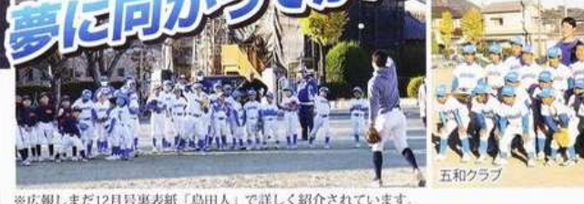
※広報しまだ12月号裏表紙「島田人」で詳しく紹介されています。