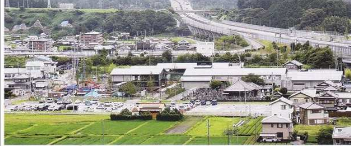
観光拠点・レストラン棟 カフェ棟

今年11月オープン(予定)に向けて、工事が進んでいます。 7/25現在 建物内には少くもつ機器も入り、順調に工事が進んでいます。