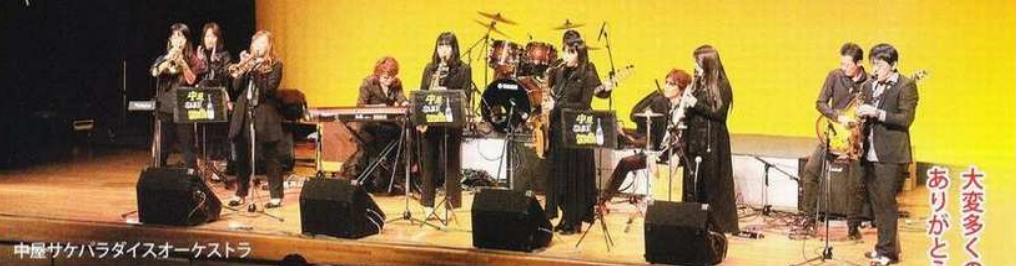
中屋サケバラダイスオーケストラ

後援：島田市・島田市教育委員会・金谷コミュニティ委員会 協賛：島市内外の事業所多数