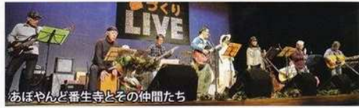
あぼやんと番生寺とその仲間たち

開演から終演までほぼ満席状態の中、練習を重ねた19バンドが実力をいかんなく発揮し、熱い競演が繰り広げられました。会場では、お客様と出演者が一体となり、音楽を楽しみながら、「島田市を音楽で元気に!!」という想いを共有し、大盛況のうちに幕を閉じることができました。