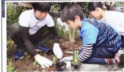
ツツジなど200本の記念植樹