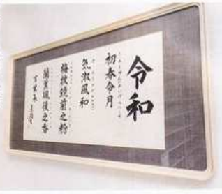
新元号の典拠となった万葉集の一節をしたためた書が自治会に寄贈され、「さんららわむ」に飾られています。