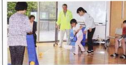
平成時代に猪土居で誕生した「リアル野球盤」の歴史を振り返り、ゲームを楽しみました。