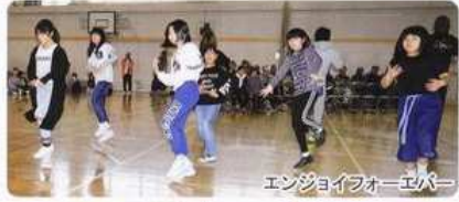
エンジョイフォーエバー