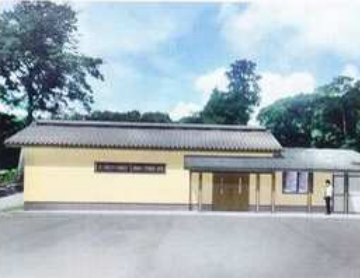
諏訪原城跡ガイダンス完成予想図

展示内容は、「日本の城の歴史や城郭用語の解説」「諏訪原城の歴史や構造」「発掘調査の結果や史跡整備事業の紹介」「出土品の展示」「静岡県内にある日本100名城及び続日本100名城の紹介」などです。歴史、お城ブーム、武将人気で、見学者も女性、若者、子供なども含めて年々増加傾向にあり、地域の活性化が期待されます。運営方法などは、現在検討中とのことです。