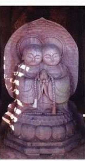
今年の合格祈願祭は 1/15(日)10時から

しまだ市民遺産 その7 すべらず地蔵尊・金谷坂石畳 平成3年に「平成の道普請・町民一人一石運動」によって甃った「旧東海道金谷坂石畳」の路傍に、有志の手によって建立されたお地蔵様があります。長い間旅人の足元を守ってきた「滑らない山石を敷いた石畳」にちなんで、「すべらず地蔵」と呼ばれ、安全に・滑らず・転ばず・着実に進めるようにと、試験合格・健康長寿・家内安全などを願ってお参りする人がたくさん訪れます。