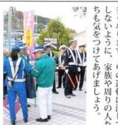
来月は金谷町やぶや会の会長さんの紹介です。

沼津市の門池連合自治会から28名の方々が、金谷コミュニティの活動の視察に来られました。自治会とコミュニティが一体となった門池の活動が大変参考になりました。