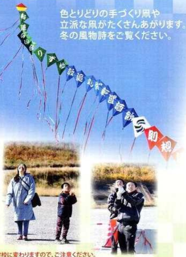
色とりどりの手づくり凧や立派な凧がたくさんあがります。冬の風物詩をご覧ください。