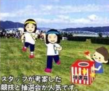
スタッフが考案した競技と抽選会が人気です。

今も継続しているのは、東町区民体育大会(ほほえみ11月号で紹介)だけ。『東町』という有志の会が中心になって企画・運営しています。