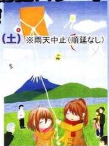
ポスター原画：金谷高等学校 美術部1・2年生共同制作

主催：交通安全・防犯パレード、凧揚げ大会実行委員会 協力：島田警察署 今年からパレードの集合場所と集会の場所が金谷小学校に変わりますので、ご注意ください。