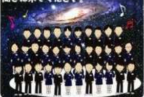
※月号はみんくる島田クラブを主催されています。