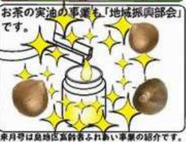
来月号は島田富科表ふれあい事業の紹介です。

五和駅 五和益長と共に「おもしろ五和駅」の企画を展開中！牧之原公園のリニューアルに、協力していきます。