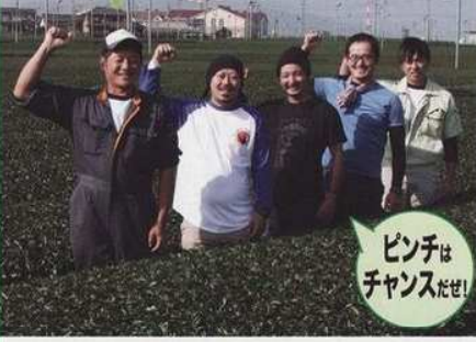
ピンチは チャンスだぜ!

新年号の巻頭に登場していただくのは、金谷農業青年研究会の皆さん。茶業の激しい時代にあってもふるさとの地に足をつけて働く若者たちの話には、金谷の未来が感じられました。(3面のかなや物語も合わせてご覧ください) ◆金谷農業青年研究会 会の設立は？ 僕たちの親世代が入っていたので、50年くらい前になると思います。 会員は？ 今日の仕事の関係で来れない人が多いのですが、全部で28名、その半数が20代後半から30代です。(事務局：JA牧之原支店) 活動は？ 月1回の定例会と、肥料などの勉強会や、視察のほか、年4回のイベントを行っています。イベントは小学生を対象に、お茶の淹れ方や手摘み体験、茶園の管理作