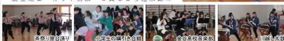
茶祭り屋台踊り 小学生の綱引き合戦 金谷高校音楽部 川越し太鼓