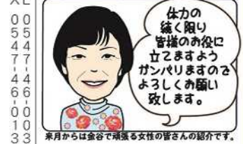
来月からは金谷で頑張る女性の皆さんの紹介です。

趣味はガーデニング。忙しい毎日の合間にバラの手入れをしています。美しいバラが咲くのを楽しみに育てています。