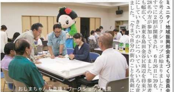
おしまちゃんも参加！ワークショップ風景

主催・金谷コミュニティ地域振興部会まちづくり委員会 金谷の未来を考えるワークショップが始まりました！ 5回のうちすでに2回が開催され、6月26日に39名、7月3日には28名の方が参加して下さいました。参加者の年齢も職業も幅広く、新東名島田金谷IC周辺を将来どのような地域にしていきたいのかについていろいろ意見を出し合いました。「今まで自分の街のことを真剣に見ておりました。」