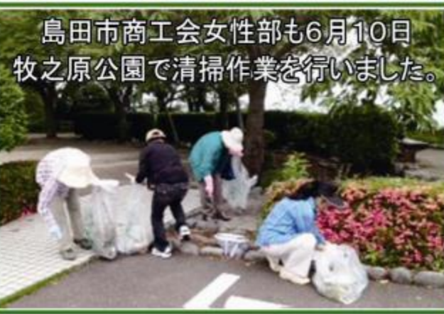
島田市商工会女性部も6月10日 牧之原公園で清掃作業を行いました。