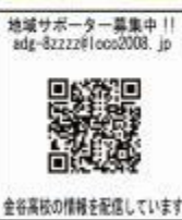
金谷高校の情報を配信しています

年が始まりました。今年度から「ほほえみ」で金谷高校からの情報を発信させていただきます。毎月の紙面を通して、金高生の様子を地域の皆さんにお知らせしていきます。また、行事案内もおせていただきますので、お時間を作ってください。金谷高校に足を運んでいただけたらと思います。宜しくお願い致します。