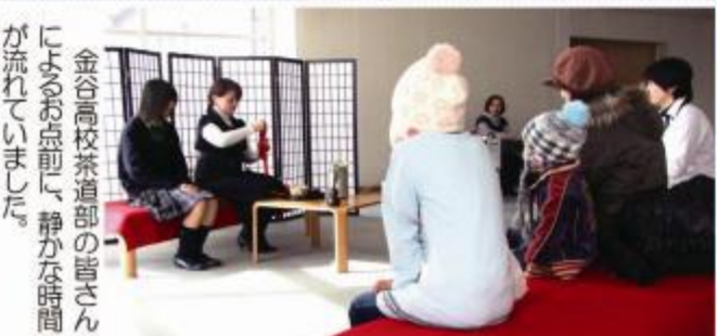
金谷高校茶道部の皆さんによるお点前。静かな時間が流れていました。

夢づくり展は、金谷地区の子供から大人まで世代を超えた作品展で、旧金谷町時代から続いています。 今年は13回目の開催で、2月3日から5日までの期間中多くの人が訪れ、力作を鑑賞しました。 今年にはタミヤ模型さんの絶大な支援を受け、プラモ愛好者の方たちも熱心に参加されていました。 （関連記事4面） ＜参加団体＞ 神谷城保善團・五和保善團 金谷中央保善團・五和幼稚園 金谷小学校・五和小学校 金谷中学校・金谷高校 藤枝特別支援学校養護学級教室 金谷信大・文化協会（一般協力） 機タミヤ（備まらじり島田）