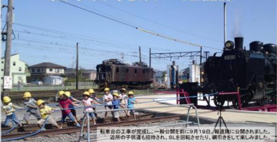
転車台の工事が完成し、一般公開を前に9月19日、報道陣に公開されました。近所の子供達も招待され、SLを回転させたり、綱引きを楽しくしました。