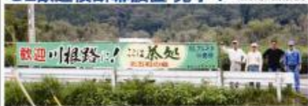
北五和自治会では、SLフェスタinかなやのイベントとして、SLの乗客の皆さんを歓迎し、茶処金谷・北五和をPRする横断幕を設置しました。