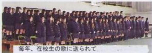
毎年、在校生の歌に送られて

【卒業証書授与式】3月1日(火) 平成22年度(第44回)卒業証書授与式が厳粛に行われました。金谷高校での高校生活を無事に終了し、新しい社会に巣立っていく121名の若者を、地域の皆様方の温かい目で見守っていただけのように今後ともよろしくお願ひいたします。