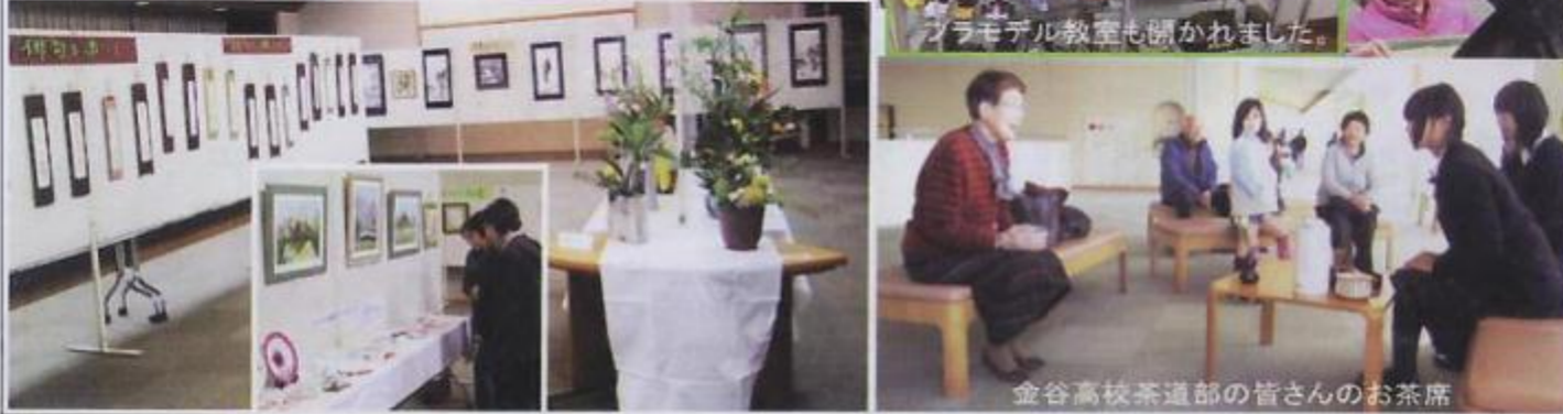
プラモデル教室も開かれました。