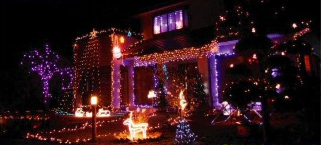
東2丁目・大井上水道の北側 見学時はマナーを守りましょう!

去年紹介できなかったところを中心に掲載しました。去年紹介したところもきれいですよ~!