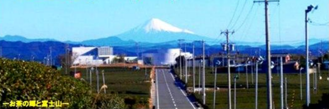
—お茶の湯と富士山—

新年明けましておめでとうございます。金谷地区会も平成十八年の設立以来、一歩ずつ活動の足跡を残してまいりました。昨年は、大代川の環境等に ついて、県土木事務所および島田市の担当課との協議が行われ、本年度の計画及び実施が決定いたしました。このことは金谷地区自治会の協力があってこそ成せたものと厚く御礼申し上げます。 今年も、大代川の環境改善・防災力の強化を重点に、金谷コミュニティ委員会をはじめ諸団体の方々と協力して、金谷地区のまちづくりの諸課題解決にむけて活動してまいりたいと考えております。 皆様には、更なるご理解とご協力をお願い申し上げます。