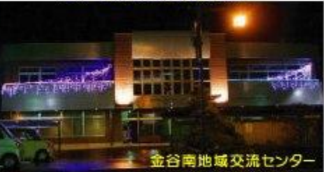
金谷南地域交流センター

「濁流記」売り切れ間近! お求めはお早めに! 昭和34年、旧金谷町大代川の決壊の痛ましい出来事の回想記が、42名の方々の寄稿によって出来上がりました。「大水害記録冊子製作委員会」の自主発行です。自治会を中心に申込をいただいておりますが、まだ知らないという方もいらっしゃるようです。在庫が少なくなっていますので、お早めにお申し込みください。1冊800円 (佐塚書店でも販売しています。)