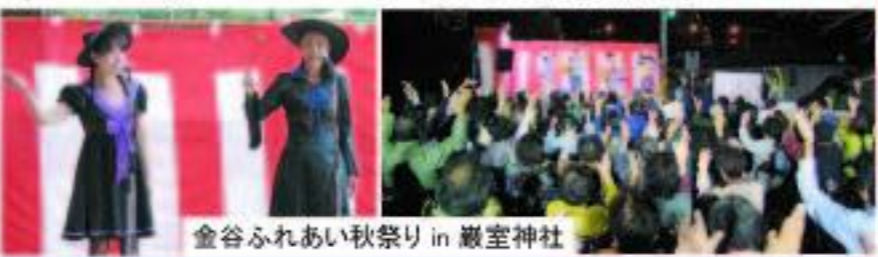
金谷ふれあい秋祭り in 巖室神社