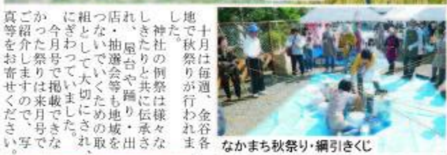
なかまち秋祭り・綱引きくじ